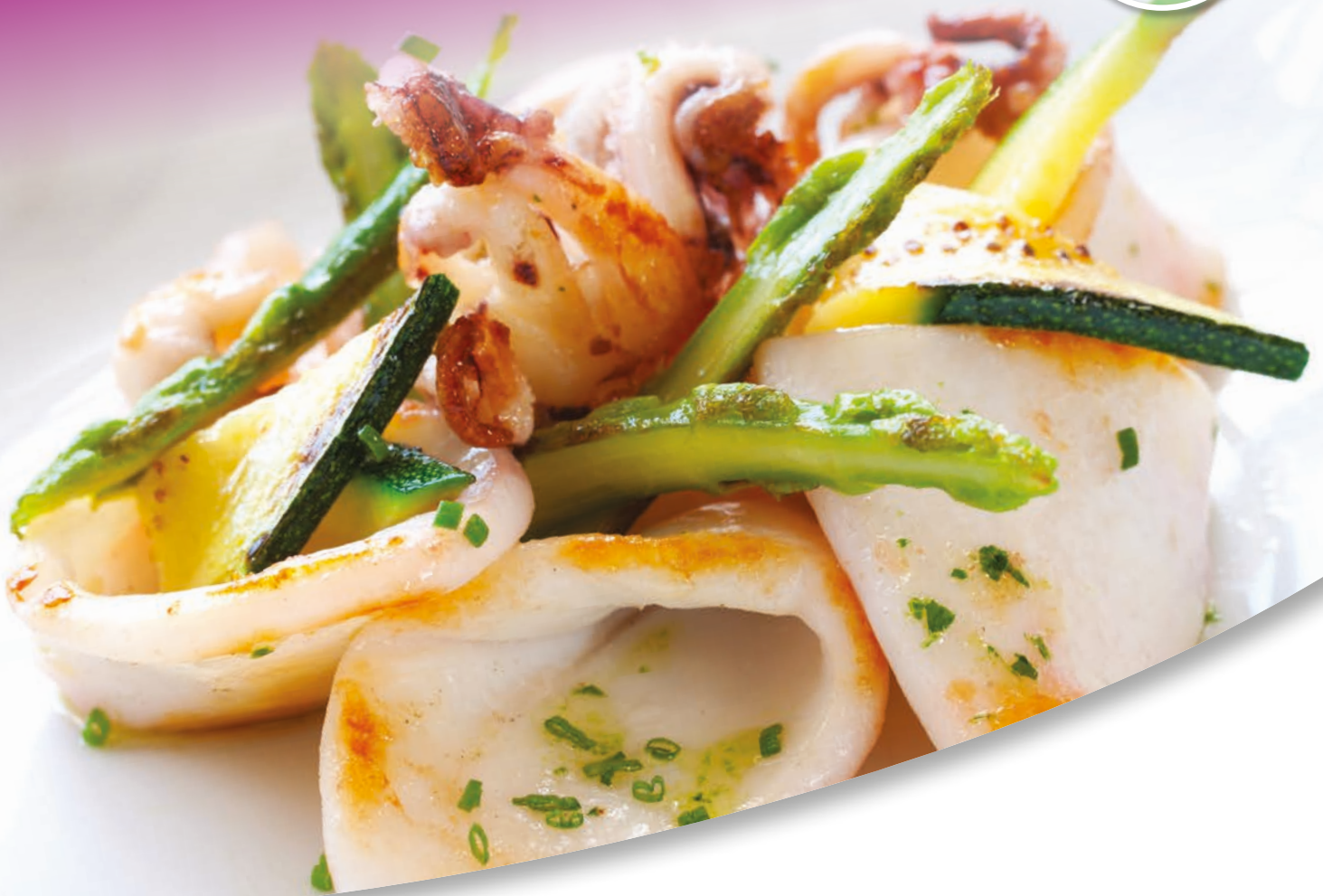
Suggestion de présentation